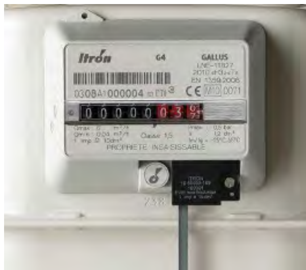
Рис. 2.5. НЧ датчик импульсов, смонтированный в гнездо отсчетного устройства счетчика