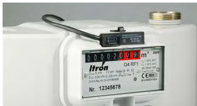
Рис. 2.6. НЧ датчик импульсов, смонтированный в гнездо отсчетного устройства счетчика