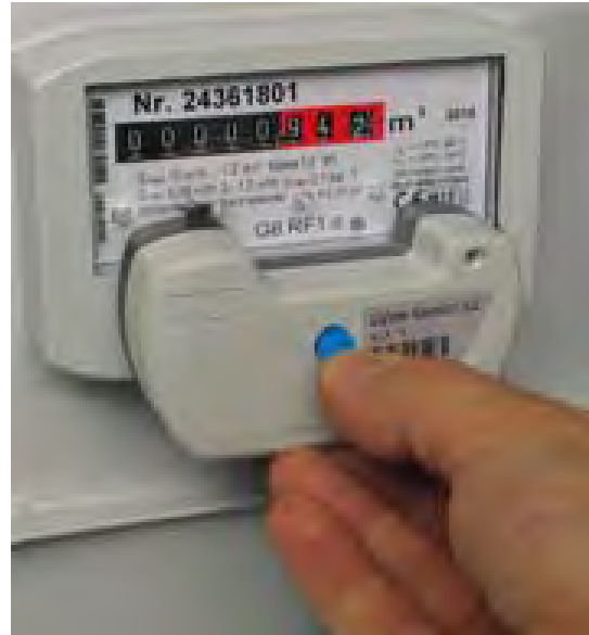
Рис. 2.2. Датчик Cyble_Sensor_ATEX V2, смонтированный на отсчетное устройство счетчика