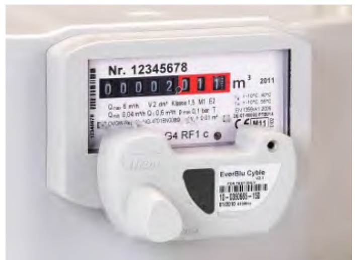
Рис. 2.4. Модуль EverBlu Cyble, смонтированный на отсчетное устройство счетчика