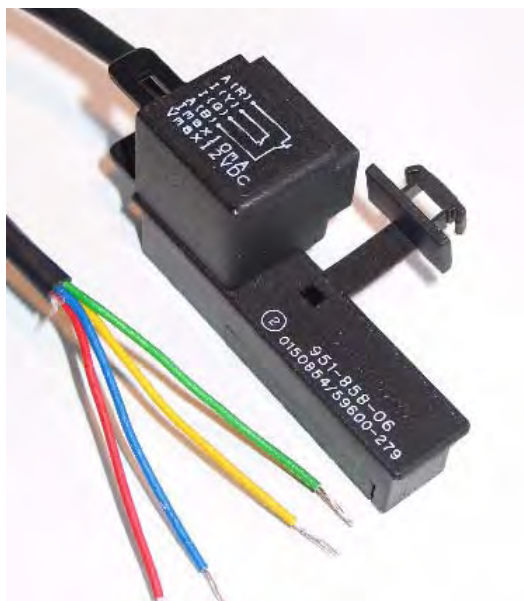
Рис. 2.5. НЧ датчик импульсов