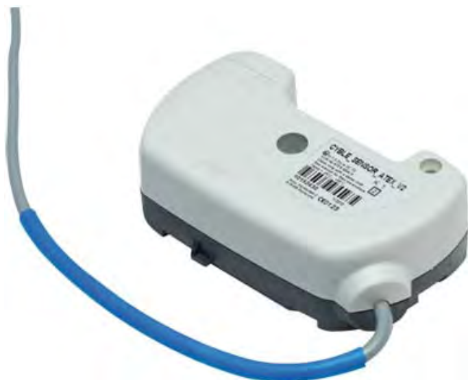
Рис. 2.1. Датчик Cyble_Sensor_ATEX V2