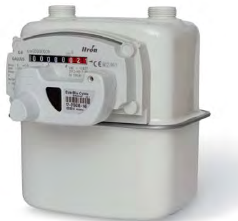
Рис. 2.4. Модуль EverBlu Cyble, смонтированный на отсчетное устройство счетчика