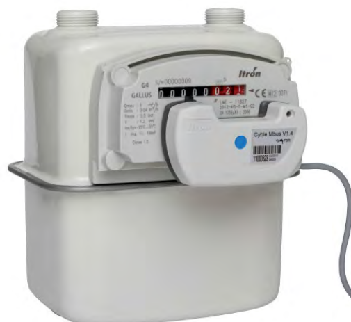
Рис. 2.2. Датчик Cyble_Sensor_ATEX V2, смонтированный на отсчетное устройство счетчика