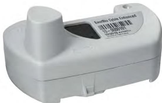
Рис. 2.3. Модуль EverBlu Cyble